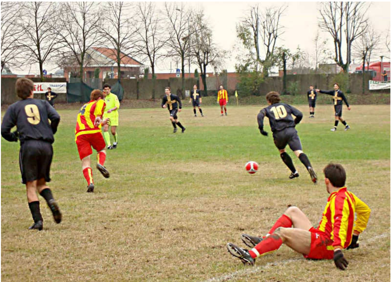
Dicembre 2008: Immagini del Derby d'Andata vinto dalla Pol Fulgor tra le mura amiche per 2 - 0